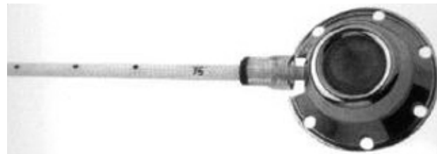
Fig. 1. El dispositivo consta de un reservorio de titanio y un catéter de silicona.