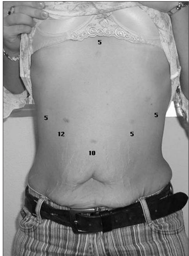
Fig. 2. Posición de los trócares.

Desde marzo de 1994 a junio de 2003, 482 pacientes han sido sometidos a un CD, 381 por vía abierta y 99 por laparoscopia. El 84%