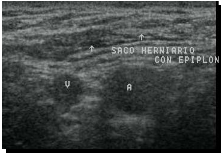
Fig 2 Hernia indirecta con epiplole en su interior.